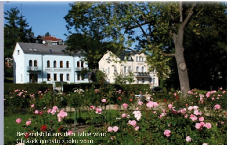
Bestandsbild aus dem Jahre 2010 Obrázek porostu z roku 2010

Bad Elster a Aš provádějí ozdravení svých parků v rámci společného projektu. Tento projekt je financován z programu Ziel 3/Cíl 3 k podpoře přeshraniční spolupráce 2007 – 2013 mezi Svobodným státem Sasko a Českou republikou. Cílem je uzpůsobit a realizovat přeshraniční hospodářské,