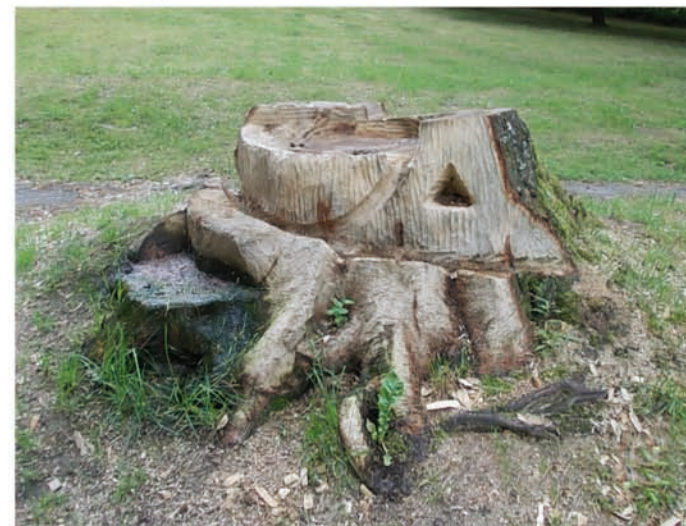
Bild unten: durch Bildhauer bearbeitete Wurzelstuppe Dole: editoval pařez sochaře kořenové

V rámci přeshraničního projektu dojde Park Bad Elster - Jak budou oživeny vedle růžové zahrady a plavební jezero v Bad Elster, stávající park-Sady Míru v Aši.