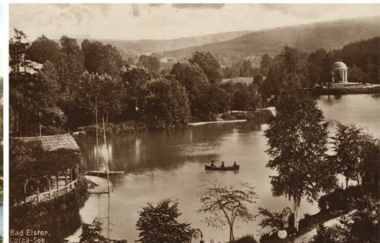
Bad Elster. Luisa-See.