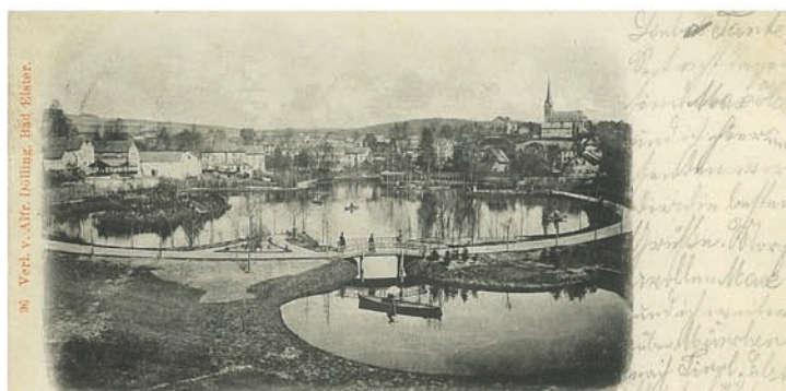
Gruss aus Bad Elster. Luisa-See

1935 přestavba ostrůvku s občerstvením a postavení dnešního strážního domku pro správce rybníka