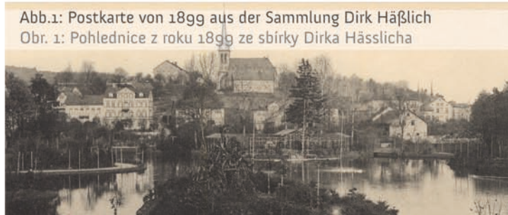
Abb.1: Postkarte von 1899 Obr. 1: Pohlednice z roku 1899

Korunní princezna Luisa Toskánská v témže roce rybník slavnostně pojmenovala na Luisino jezero. Avšak poté, co její manželství bylo v roce 1903 rozvedeno a Luisa musela v noci a mlze uprchnout, byla vodní nádrž přejmenována na dnešní 'Gondelteich' - rybník s gondolami.